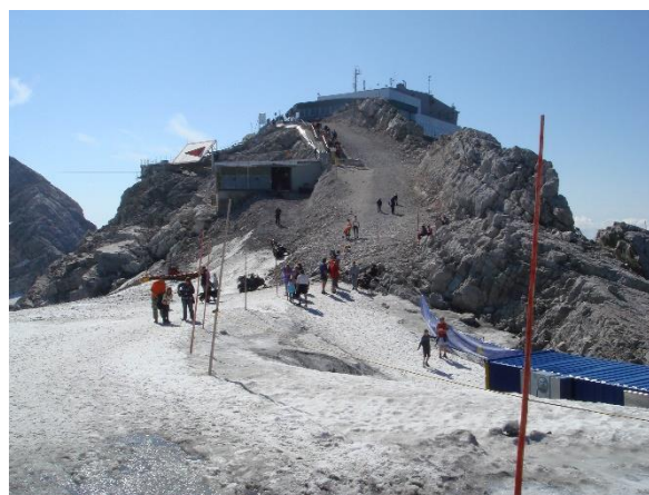
Reiteralm und Dachstein

Einen sportlichen und erholsamen Sommer 2019 wünschen Euch herzlichst Euer Obmann Helmut Apfelauer + Team